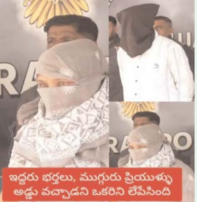
ఇద్దరు భర్తలు, ముగ్గురు ప్రియుళ్ళు అడ్డు వచ్చాడని ఒకరిని లేపేసింది

ఆ తర్వాత భర్తను వదిలేసి అతనితో కాపురం పెట్టింది ఆ తర్వాత కొన్నాళ్ళకి పక్కంటి వ్యక్తితో అక్రమ సంబంధం పెట్టుకుంది. అభ్యంతరం చెప్పాడని, రెండో భర్తను హత్య చేసింది. అతర్వాత ఆ ప్రియుడుతో వేరే చోటికి వెళ్లి అక్కడ కాపురం పెట్టింది . అక్కడ కూడా వేరే వ్యక్తితో అక్రమ సంబంధం మళ్లీ ఇతడు హత్య. ఇలాగే అక్రమ సంబంధం మీద అక్రమ సంబంధం.. ఆమె రూట్ వేరు. కొన్ని వివాహ సంబంధాలలో , మహిళాల్లో మానసిక పాపం ప్రవృత్తి, అక్రమ సంబంధాలపై మోజు ఎలా పెరిగిపోతున్నాయో ఈ సంఘటన ఉదాహరణ. గుజరాత్