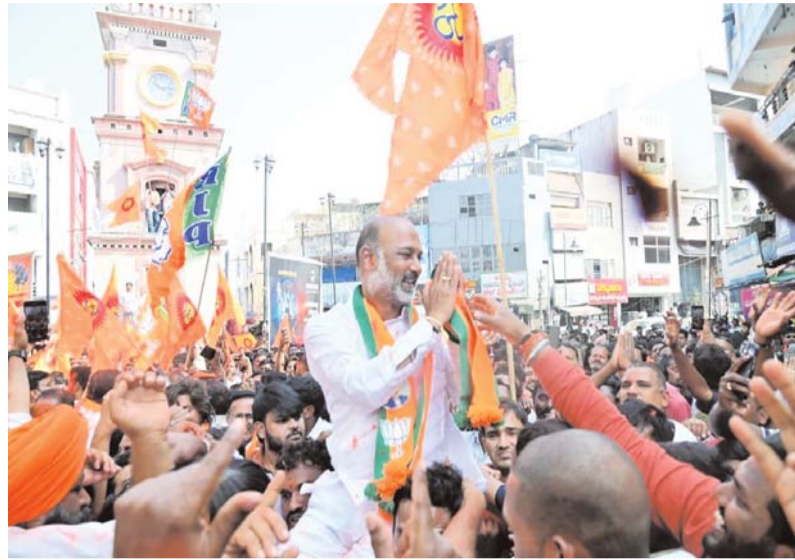
బీజేపీ మేయర్ కమ్ గెలుకుంది. బీజేపీని ఓడించేందుకు చెప్పలేని, కంటికి కన్నులించిన కుట్రలన్నీ జరిగాయి. అధికారం చేతిలో ఉంది కదా అని... బీజేపీ 30 సీట్లు సాధించినా, ఇండిపెండెంట్ల ముఖ్యమంత్రి మొదలుకుని మంత్రులు, కాంగ్రెస్, బీఆర్ఎస్, మజ్దన్ పార్టీలన్నీ కలిసి రెండ్రోజులుగా జరుగుతున్న కుట్రలను చూసి ప్రజలే విస్తుపోయారు. ఇన్ని కుట్రలు, కుతంత్రాలు చేసి ప్రజాస్వామ్యాన్ని అపహాస్యం చేయాలనుకుంటున్నారా? అంటూ సోషల్ మీడియా వేదికగా నెటిజన్లు ఆగ్రహం వ్యక్తం చేశారు. ఎక్కడ చూసినా ఇదే చర్చ జరిగింది. రాష్ట్రంలో అధికార మార్పిడి జరగాలన్నా, తెలంగాణ వచ్చినా కరీంనగర్ వేదికగా మార్పు మొదలైన సంగతి తెలిసిందే. అందులో భాగంగానే కరీంనగర్ మేయర్ పదవిని బీజేపీ కైవసం చేసుకుంటే రాష్ట్రంలోనూ బీజేపీ అధికారంలోకి రావడం తప్పవనే భయంతో కాంగ్రెస్, బీఆర్ఎస్, మజ్దన్ పార్టీలన్నీ ఒక్కటై కుట్ర చేశాయి.