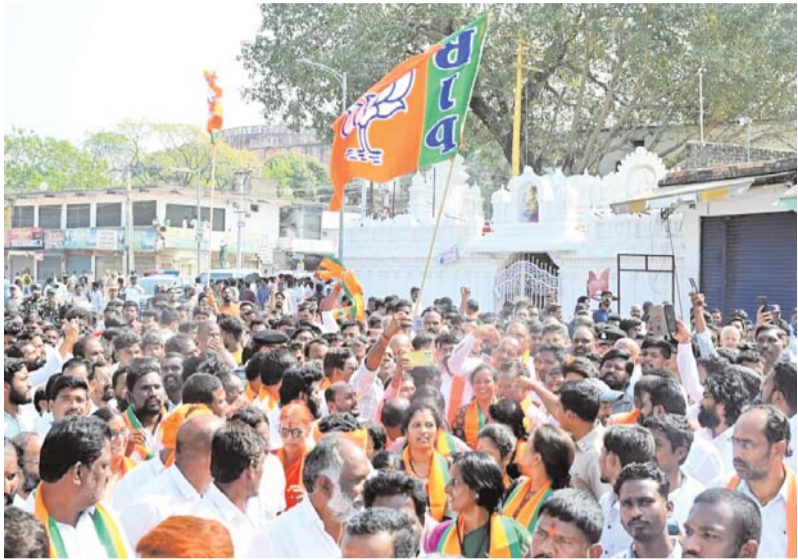
బీఆర్ఎస్, ఎంఐఎంతో కలిసి సీఎం, మంత్రులు చేసిన కుట్రలన్నీ తెలుసు కంటికి కన్నులించిన కుట్రలన్నీ చేశారు...